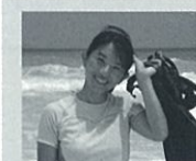
ふるや ちかこ 古谷 千佳子 写真家

沖縄の建築様式をいかしたデザインで都市部における快適な生活空間づくりを実践している。2007年には「東京町家・町角の家」で、経済産業大臣賞を受賞。現在はi-works project(住まいの標準化)を推進するなど、幅広い活動中。著書に『子供たちに伝えたい住まいの話「オキナワの家」』『伊礼智の住宅設計』、他